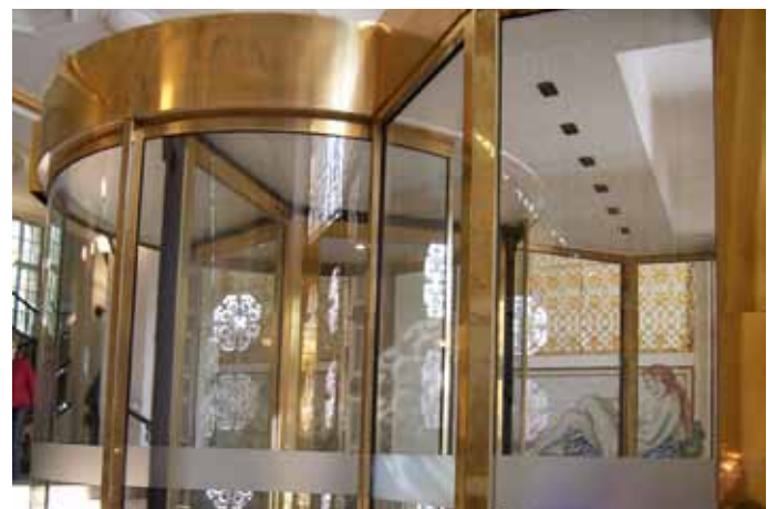
Unauffälliger Einbau von Infrarot-Sensoren im Türbereich.

Die Datenerfassung erfolgt über einen oder mehrere aktive Infrarot-Sensoren. Diese werden in einem Sensorbalken (möglichst unauffällig) horizontal im Abstand von 35-40 cm (ideal 37,5 cm) in max. 2,70 Meter Höhe im jeweiligen Durchgangsbereich angeordnet.