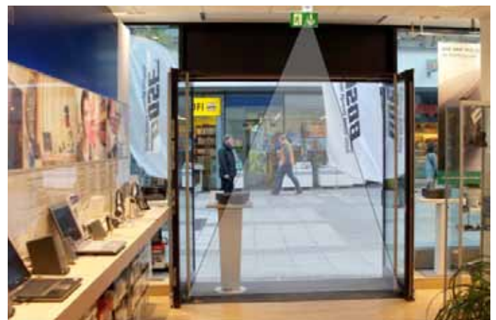
Einbau eines OptoCount Sensor mit definiertem Zählbereich.

Für die Befestigung der Sensoren steht eine Anzahl an Befestigungssätzen für die Oberflächenmontage oder flächenbündigen Einbau zur Verfügung. So kann der Sensor z.B. anstelle einer Deckenplatte in eine Rasterdecke eingehängt werden. Je nach Standort wird in der Feinspezifikation die geeignete Auswahl getroffen.