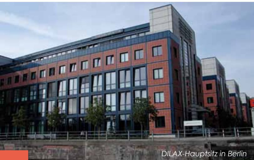
DILAX-Hauptsitz in Berlin

Sitz der Firmenzentrale ist Berlin, Deutschland. Weitere Tochterunternehmen befinden sich in Frankreich, Großbritannien, Italien, Kanada, Spanien und in der Schweiz. Die Mitarbeiterzahl beläuft sich derzeit auf insgesamt 70 Personen (2010). Zwei Drittel der Angestellten sind Diplom-Ingenieure und qualifizierte Fachkräfte aus den unterschiedlichsten Bereichen, die sich im Wesentlichen der Entwicklung von Hardware und Software, dem Qualitätswesen, dem Projektmanagement und dem Kundenservice widmen.