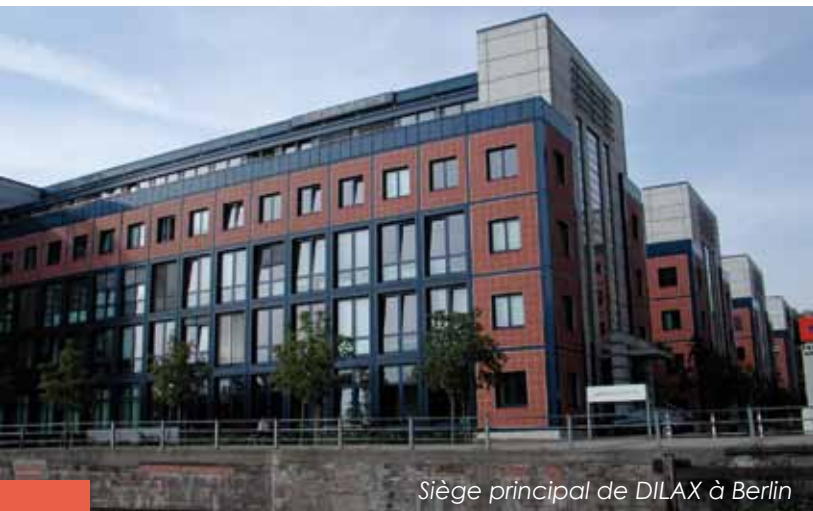
Siège principal de DILAX à Berlin

Le siège de l'entreprise se trouve à Berlin, en Allemagne. DILAX a également des filiales en Canada, en Espagne, en France, en Grande-Bretagne, en Italie, et en Suisse et emploie actuellement 70 personnes (chiffre de 2010). Deux tiers des employés sont des ingénieurs diplômés et des personnes qualifiées issues des secteurs les plus divers et qui se consacrent essentiellement au développement des équipements et logiciels, à la qualité, à la gestion de projet et à l'après-vente.